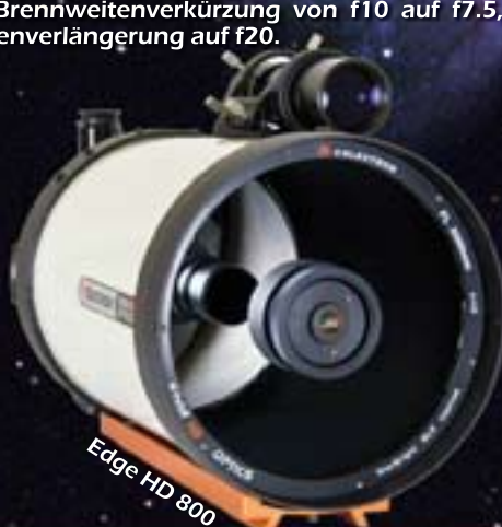
Edge HD 800

An allen Celestron SC Teleskopen die mit Fastar Fangspiegelfassungen versehen sind, z.B. die "EdgeHD"-Serie, sowie viele ältere Celestron SC's mit 8", 9 1/4", 11" und 14" die einen "Fastar compatible" Aufkleber haben. Alle anderen Celestron SC's ab 8" lassen sich mit optionalen Umbaukits umrüsten.