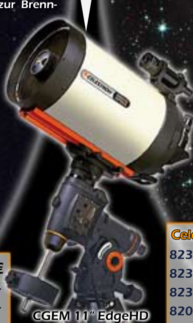
CGEM 11" EdgeHD